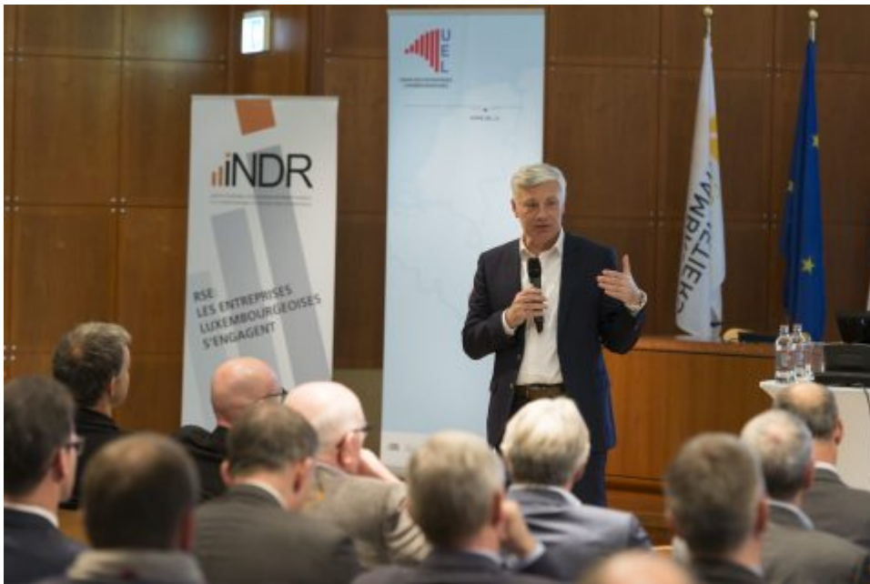
Invité de l'honneur, Claude Wiseler

Depuis quelques années, l'UEL questionne le modèle de croissance luxembourgeois et son lien avec les finances publiques et le financement des retraites. Afin de débattre de cette thématique primordiale pour le développement à moyen terme des entreprises, l'UEL a invité les représentants des Assemblées plénières et Conseils d'administration des Chambres et Fédérations patronales du Luxembourg ainsi que des chefs d'entreprise à une conférence qui a eu lieu le 23 octobre à la Chambre des Métiers.