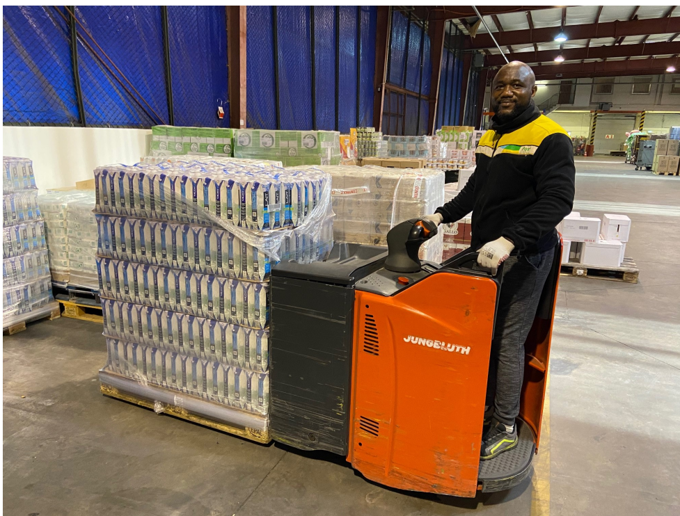
La livraison des colis

Afin de répondre à cette forte hausse du volume des colis, les livreurs de Michel Greco S.A. et les facteurs de POST Luxembourg sont tous mobilisés. POST suit de près la disponibilité de ses effectifs et procède à des réaffectations de personnel en intégrant d'autres collaborateurs de POST qui se portent volontaires pour soutenir entre autres les équipes du Centre de Tri.