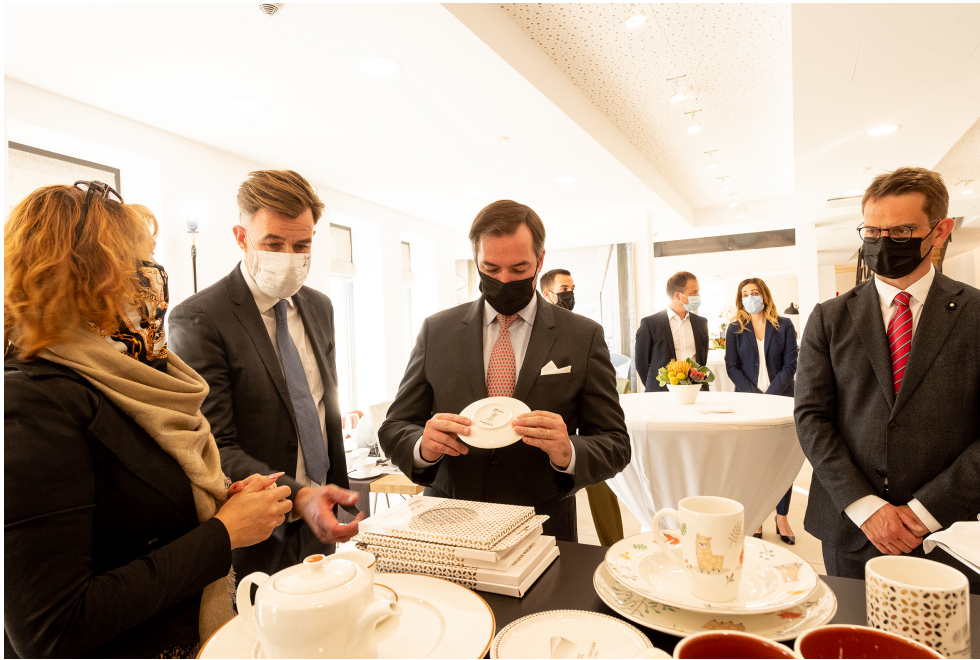
Bettembourg, le 7 octobre 2021